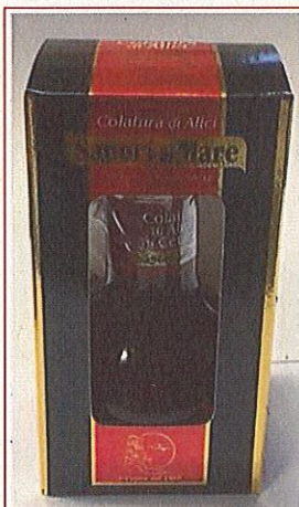
Inserire immagine uno:

Per ulteriori informazioni rivolgersi al fornitore al numero : 089 56 6347 - mail : iasasrl@tin.it